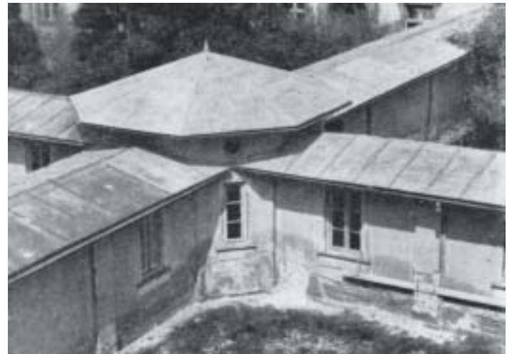
Zračni posnetek bolnišnice iz leta 1962. V ospredju je lepo viden najstarejši del bolnišnice s štirikrako Prosenjakovo hišo v sredini, internističnim in kirurškim traktom na obeh straneh, ostankom "križnega" hodnika in že povečano kubinjo.

nišnici. Vedeti moramo, da bolnišnica ni imela operacijskih prostorov, tako da so nekatere operacije včasih potekale kar v upraviteljevi pisarni. Pisarna je bila neizrabljena - včasih je služila kot bolniška soba, včasih pa tudi kot šivalnica.