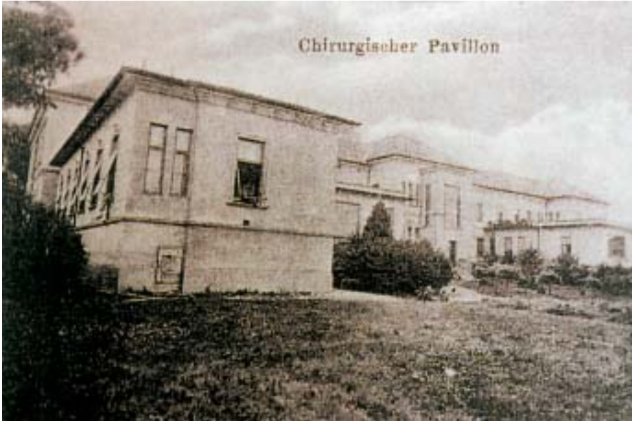
Kirurška stavba, 1913