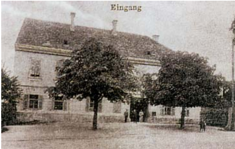
Glavni vhod, Prosenjakova hiša, 1913