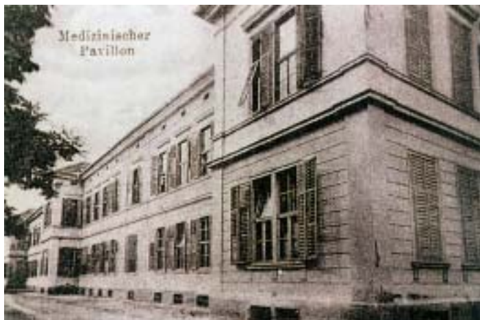
Medicinska stavba, 1913

bor, ki so ga sestavljali upravnik zavoda, zdravniki, župan občine in dva občinska odbornika. Odbor je deloval pod nadzorom deželne odbora za zdravstvo. Približno eno leto po tem so to obliko opustili, tako da sta kasneje vodila bolnišnico njen upravnik in deželni odbor.