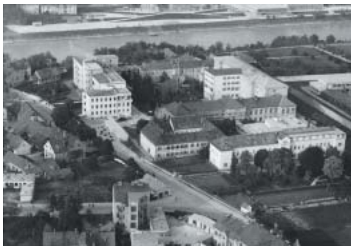
Prosenjakova hiša (najstarejši del bolnišnice) na Tržaški cesti 13 po prvi svetovni vojni

višini 50.000 fl. Gradbena dela je prevzel stavbenik Andrej Küfner iz Maribora in jih opravil do 12. septembra 1891. Uradni pregled poslopja so opravili 6. novembra, stavbo pa so začeli uporabljati 23. novembra 1891. To je bilo poslopje starega internega oddelka, ki smo ga uporabljali vse do dograditve novega internega oddelka leta 1993. Zgradbo smo porušili leta 1998 in na njenem mestu se je leta 1999 začela gradnja otorinolaringološkega in okulističnega oddelka ter bolnišnične kapele. Zavod je tako imel tedaj prostora za 190 do 200 bolnikov; to je bil glede na poprejšnjih 110 bolnikov kar velik napredek; zvišala pa se je tudi oskrbnina, ki je odtlej znašala 65 fl na dan (1). Tudi število uslužbencev v bolnišnici se je spremenilo. Leta 1892 je bilo zaposlenih 22 oseb, in sicer upravnik, pomožni uradnik, ordinarij, sekundarij, trije strežniki, osem sester, dve sestri s poldnevno službo, ena strežnica, ena pomožna strežnica, dve dekli, en hlapec, dve perici,