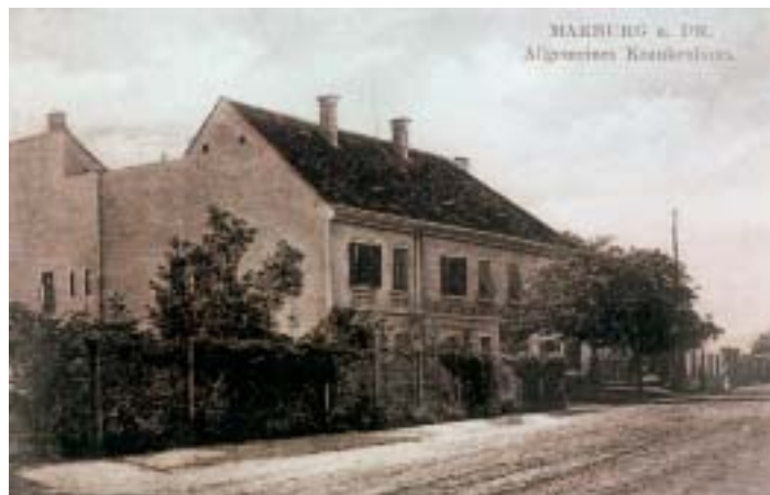
Mariborska bolnišnica, Prosenjakova hiša, 1909

Na prelomu stoletja je bila bolnišnica pod nadzorom okrožnega urada in mestne uprave. V njej je bilo poleg bolnih še veliko onemoglih, revnih in tudi duševno bolnih. Šele z ustanovitvijo umobolnice v Gradcu, ki je sprejemala duševno bolne iz vse dežele Štajerske, in ločitvijo onemoglih od bolnih, je dobila Bolnišnica Maribor značaj zdravstvene institucije. Poročila o delu bolnišnice je uprava vsak mesec pošiljala magistratu in okrožnemu uradu ter enkrat letno deželnemu guberniju v Gradec. Mariborska bolnišnica se je ves čas ubadala tudi z gmotnimi težavami. O tem priča poročilo okrožnega glavarja, barona Grimschitza, ki se je leta 1807 obrnil na vse okrajne magistrate in župnišča, torej na vso posvetno in duhovno oblast, naj se vključijo v zbiranje prispevkov za vzdrževanje bolnišnice (1). Francoske vojne so neugodno vplivale tudi na razvoj zdravstva. Država je leta 1811 razglasila plačilno nezmožnost. Tako so z dvornim dekretom leta 1819 vse bolnišnice in hiralnice razglasili za krajevne zavode in so jih mo-