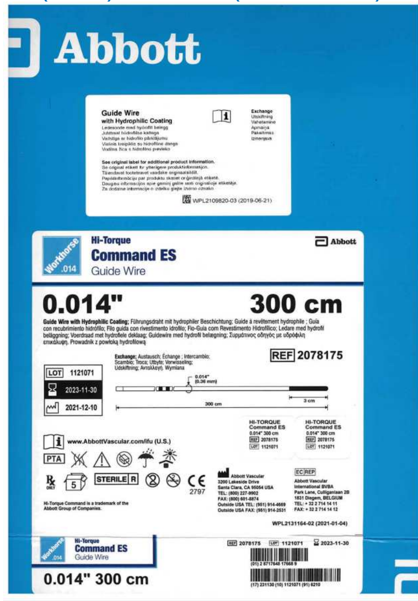
Slika 2 (** PRIMARY): POSAMEZNI KOMAD (GTIN=08717648176685)